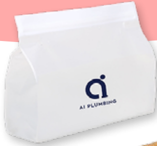
SAC COLLATION RÉUTILISABLE 3,69$* /un. *Quantité : 250