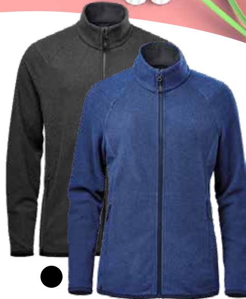
MANTEAU NOVARRA 53,35$* /un. *Quantité : 25