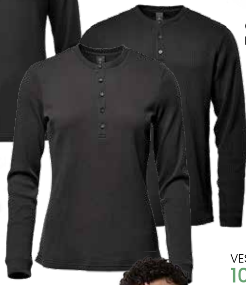
CHANDAIL AVEC BOUTONS ASHBURN 46,69$* /un. *Quantité : 25