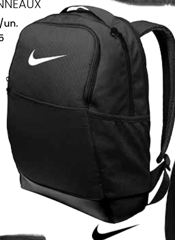
SAC À DOS 64,99$* /un. *Quantité : 24