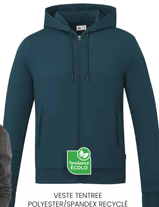
VESTE TENTREE POLYESTER/SPANDEX RECYCLÉ POUR HOMME