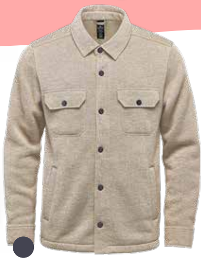
CHEMISE POLAIRE POUR HOMME 86,69$* /un. *Quantité : 25