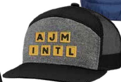
CASQUETTE 7 PANNEAUX 16,45$* /un. *Quantité : 25