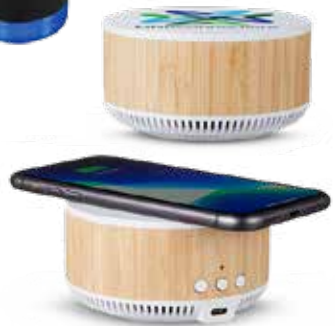
CHARGEUR PORTATIF ET HAUT-PARLEUR SANS FIL 80,59$* /un. *Quantité : 15