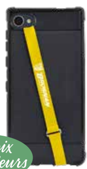
SANGLE DE TÉLÉPHONE EN SILICONE 3,55$* /un. *Quantité : 150