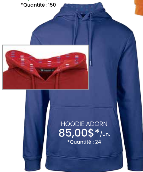
HOODIE ADORN 85,00$* /un.