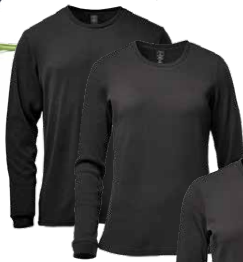
CHANDAIL COL ROND ASHBURN 43,40$* /un. *Quantité : 25