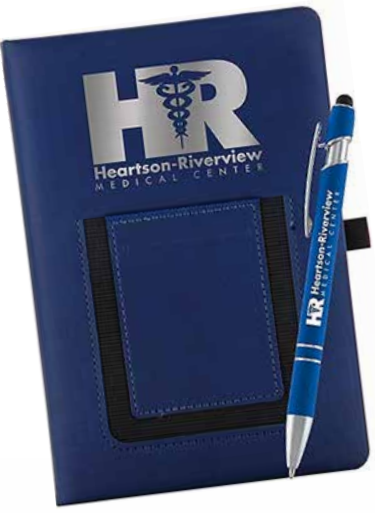
COMBO JOURNAL AVEC POCLETTE ET STYLO 18,60$* /un. *Quantité : 25