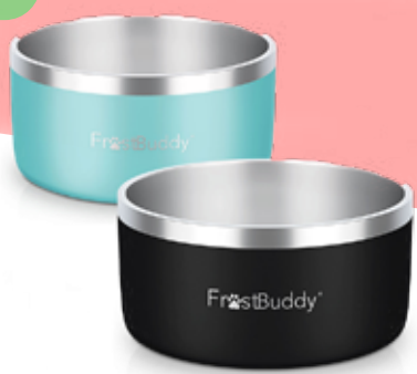
BOL POUR ANIMAL FROST BUDDY 69,99$* /un. *Quantité : 20