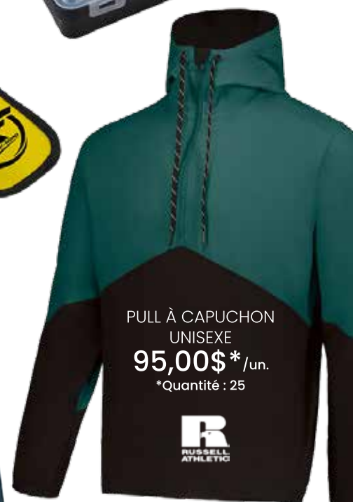
PULL À CAPUCHON UNISEXE