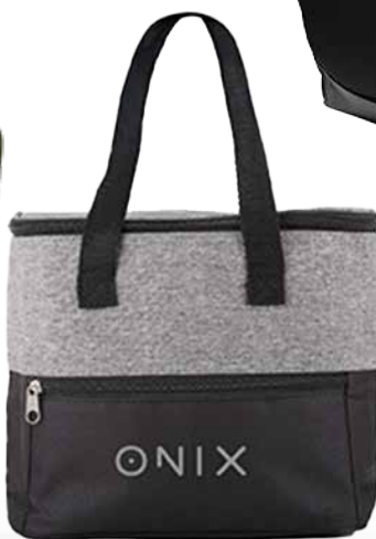
SAC RÉFRIGÉRANT 12,85$* /un. *Quantité : 50