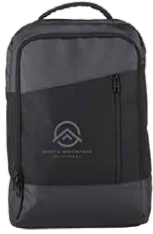
SAC À DOS NOCTURNE 10L 55,50$* /un. *Quantité : 12