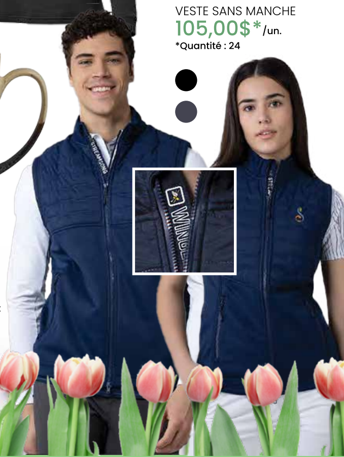
VESTE SANS MANCHE 105,00$* /un. *Quantité : 24