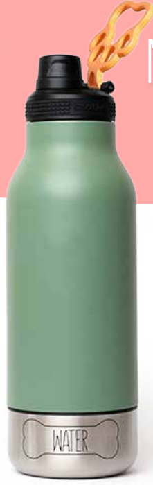
BOUEILLE 3 EN 1 POUR VOUS ET VOTRE ANIMAL DE COMPAGNIE! 38,65$* /un. *Quantité : 48