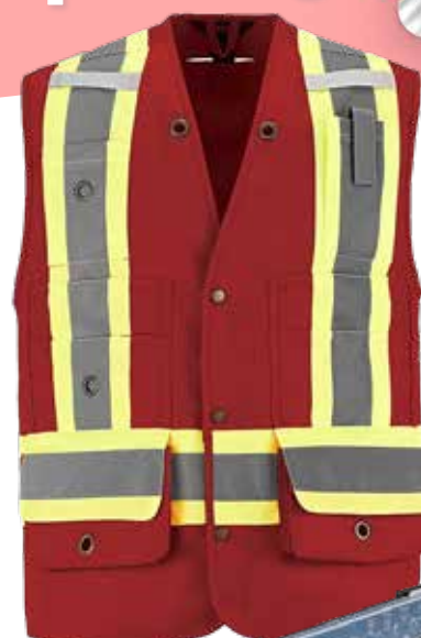
VESTE DE SÉCURITÉ POUR ARPENTEUR