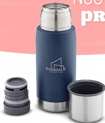
BOUTEILLE DRI DUCK 19 OZ 32,25$* /un. *Quantité : 24