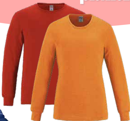
CHANDAIL COL ROND COTON