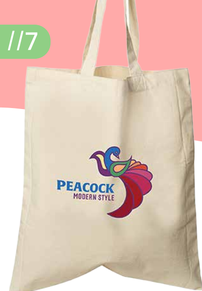
SAC COTON 7 OZ