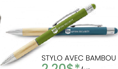
STYLO AVEC BAMBOU 2,20$* /un. *Quantité : 100