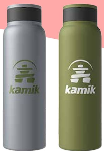
BOUTEILLE ISOTHERME 25 OZ 30,00$* /un. *Quantité : 25