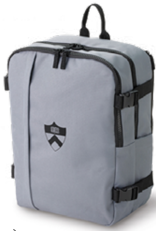
SAC À DOS RENEW 59,99$* /un. *Quantité : 25