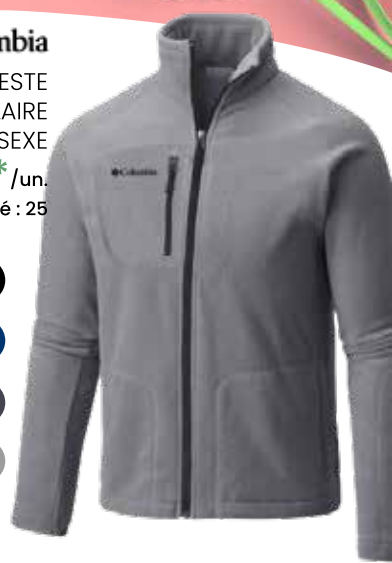
VESTE MICROPOLAIRE UNISEXE 79,50$* /un. *Quantité : 25