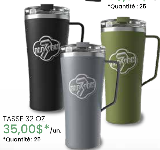
TASSE 32 OZ 35,00$* /un. *Quantité : 25