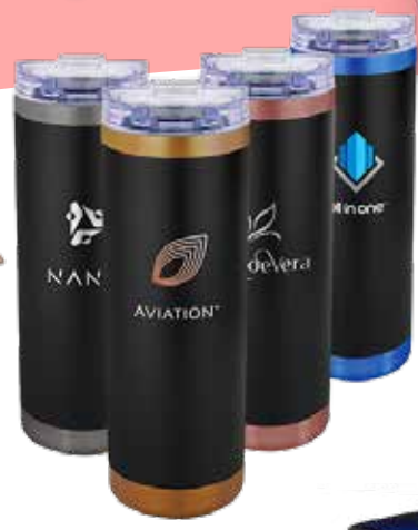
BOUTEILLE ISOLANTE 16 OZ 29,99$* /un. *Quantité : 24