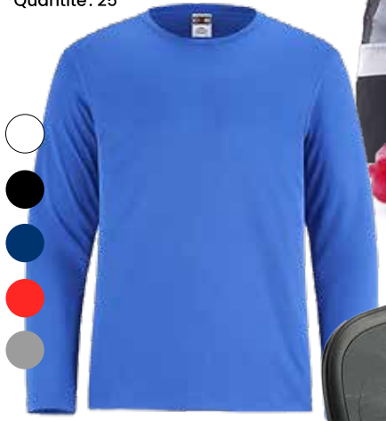
CHANDAIL POLYESTER POUR HOMME 18,00$* /un. *Quantité : 25