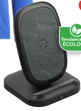
STATION DE RECHARGE 125,75$* /un. *Quantité : 10