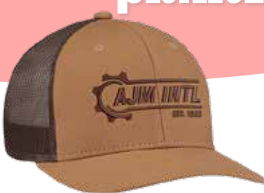
CASQUETTE CANEVAS "DUCK" 16,60$* /un. *Quantité : 25