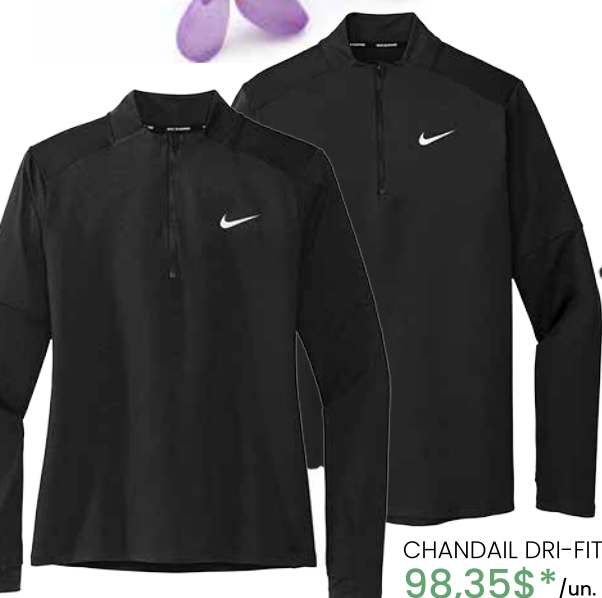
CHANDAIL DRI-FIT À DEMI-GLISSIÈRE 98,35$* /un. *Quantité : 25