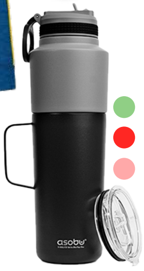
BOUTEILLE THERMOS 37,95$* /un. *Quantité : 48