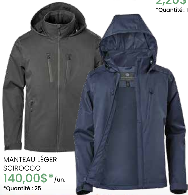
MANTEAU LÉGER SCIROCCO 140,00$* /un. *Quantité : 25