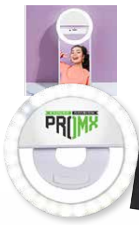
LUMIÈRE POUR SELFIE 7,99$* /un. *Quantité : 100