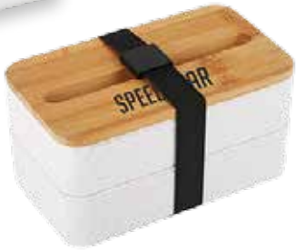
BOÎTE BENTO DOUBLE AVEC PORTE-CELLULAIRE 17,99$* /un. *QUANTITÉ : 48