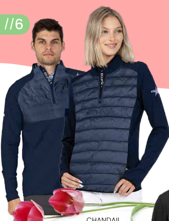
CHANDAIL PERFORMANCE EMBER 113,35$* /un. *Quantité : 24