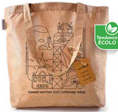
SAC EN CHANVRE 6,25$* /un. *Quantité : 100