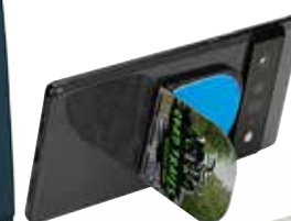
PORTE CELLULAIRE "FLIPSTIK"