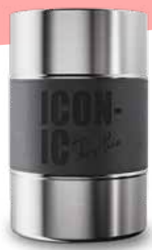
REFROIDISSEUR DE BOUTEILLE 46,99$* /un. *Quantité : 25